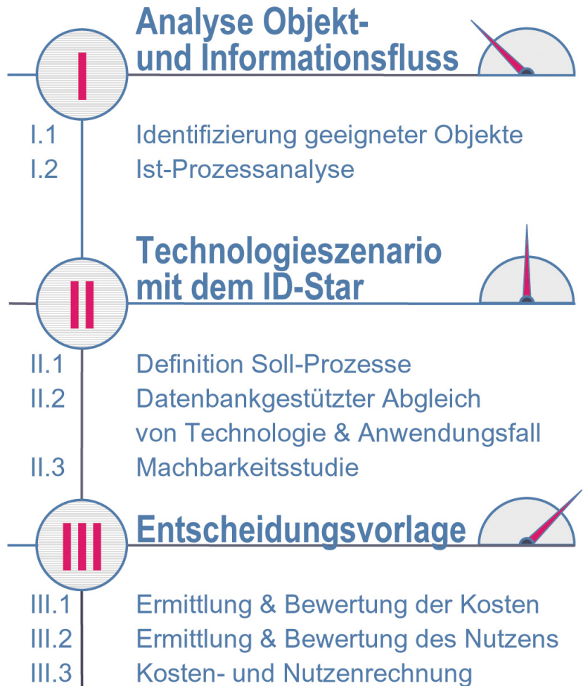
Abbildung 1: RFID-Business Case Calculation – 3-stufiges Vorgehen zur Kosten- und Nutzenbewertung des Auto-ID Einsatzes

Das Thema „automatische Identifikationstechnologien“ (Auto-ID) erfährt bereits seit längerem eine große und stetig wachsende Aufmerksamkeit. Besonders im Einzelhandel und in der Logistik, aber auch im Gesundheitssektor und in der produzierenden Industrie ist vor Allem die Radiofrequenzidentifikation (RFID) vielerorts im Gespräch. Dies ist auf die kontinuierliche Verbesserung der Technologie in den letzten Jahren zurück zu führen. So wurden Probleme wie fehlende Standards, unzureichende Lesereichweiten oder der negative Einfluss von Metall und Flüssigkeiten gelöst oder zumindest vermindert. Trotzdem halten sich immer noch viele Anwender mit Investitionen in RFID-Systeme zurück [1] [2]. Dies gilt im speziellen für kleine und mittlere Unternehmen (kmU). Neben den fehlenden Business Cases und den Unsicherheiten bezüglich der Technologiereife von RFID wird die mangelnde methodische Unterstützung bei der Kosten- und Nutzenbewertung als ein Hauptgrund für das Scheitern von Projekten zur Einführung von RFID-Systemen genannt. Aus diesem Grund hat das FIR im Rahmen des von der Stiftung Industrieforschung geförderten Projekts RFID-EAs eine Methodik zur Kosten- und Nutzenbewertung entwickelt, die das 3-stufige Vorgehen der RFID-Business Case Calculation zur Planung und Bewertung von RFID-Systemen integriert ist und dieses mit der Bereitstellung einer Entscheidungsvorlage abschließt [3] (siehe Abbildung 1).